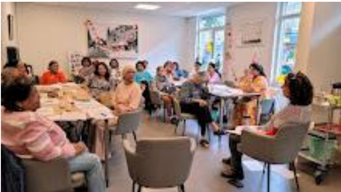
Omgaan met verlies